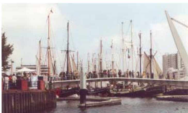
Veranstaltungen wie das Logger-Treffen in Vegesack gehören auch zu den Aktivitäten des MTV Nautilus.

S ollen die Erinnerungen an technische Meisterleistungen, an die praktische Seemannschaft an Bord von Großseglern oder die Härte des Fischfangs in der nördlichen Nordsee nicht verloren gehen, muss jemand daran erinnern. Müssen Interessierte forschen und diskutieren, sammeln, befragen und ausprobieren. Gemeinsam mit den Medien, mit Lehrern und ihren Schülern, mit Studenten und Bürgern, die sich für die „maritime Heimatkunde“ interessieren. Dazu gehören Traditionsschiffe und natürlich die Möglichkeit, mit Ihnen auf Flüssen sowie der Nord- und Ostsee unterwegs zu sein.