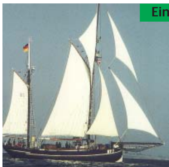
Unter Segeln unterwegs als Botschafter Vegesacks: Der Segellogger BV 2 „Vegesack“.

F ür all dies gibt es seit 1987 in Vegesack den Verein Maritime Tradition Vegesack Nautilus e.V., kurz MTV Nautilus, der gerne an diese und andere Traditionen erinnert. Nicht nur trocken und an Land, sondern auch mit Hilfe von Traditionsschiffen, wie dem 35 Meter langen Segellogger „Vegesack“, der als erstes Schiff der früheren Großwerft Bremer Vulkan 1895 abgeliefert wurde. Bei der „Bremen-Vegesacker Fischerei-Gesellschaft“ erhielt der Logger, getreu dem Firmennamen, das Fischereizeichen „BV 2“, als zweites Schiff der Heringsfänger-Flotte.